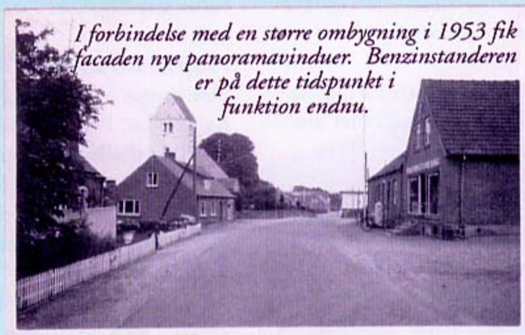
I forbindelse med en større ombygning i 1953 fik facaden nye panoramavinduer. Benzinstanderen er på dette tidspunkt i funktion endnu.

Nye tider, nye varegrupper, nyt navn. I stedet for at købe ind i sække, baljer, dusin og tønder, for senere at afveje det ønskede køb i butikken, begynder varende nu at være emballerede i handy poser og kartoner med forbruger-venlige varedeklarerationer. Produkterne bliver mere forarbejdede og bestilles af uddelejerne via dataterminaler til levering i kvartpaller direkte i brugsens lagerrum om natten. Der sælges en større del ferske varer, som frugt kød og mælkeprodukter i alle afskygninger. Melsalget daler mens omsætningen af friskbagt brød og langtidsholdbare kager vokser. Brugsen vil være "din nærbutik" (på engelsk - convenience store), med hyggelig